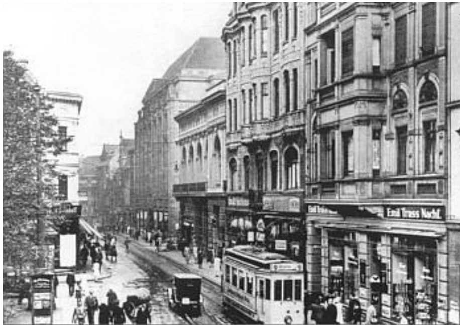
Innenstadt ca. 1930